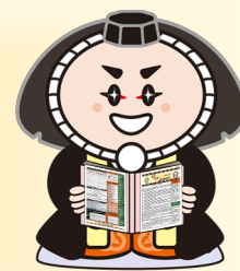
小松市イメージキャラクター「カブッキー」